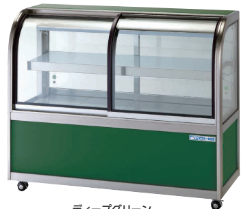
ディープグリーン