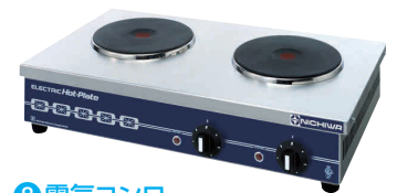
8 電気コンロ THP-2W [EDKO-08] E 納 値 200V

13-0338-0701 ¥60,000 サイズ:300×340×H120 重量:6kg 電源・消費電力:単相200V 1.5kW ヒーターサイズ:φ190 リード線2m・引掛プラグ付き 接地2P・20A◎