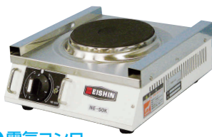
1 電気コンロ NE-50K [EDKO-01] G

13-0338-0101 ¥52,000 サイズ:270×300×H100 重量:4kg 電源・消費電力:単相100V 1kW ヒーターサイズ:φ150 温度調節:6段切替式