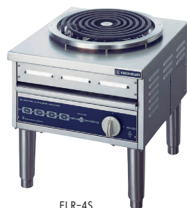
16 電気ローレンジ (スタンドタイプ) ELR-4S [EDKO-14] E 納 値 200V