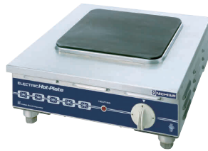
10 電気コンロ THP-4 [EDKO-10] E 納 値 200V

13-0338-0901 ¥149,000 サイズ:350×400×H170 重量:9.5kg 電源・消費電力:単相200V 2.0kW ヒーターサイズ:220×220 リード線2m・引掛プラグ付き 接地2P・20A◎