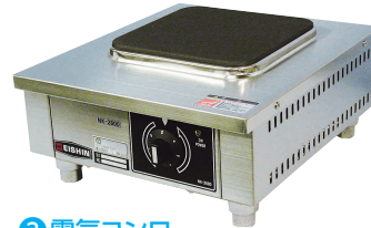
3 電気コンロ NK-2600 [EDKO-03] G 納 値 200V

13-0338-0201 ¥60,000 サイズ:370×300×H100 重量:5kg 電源・消費電力:単相100V 1kW ヒーターサイズ:φ150 温度調節:6段切替式