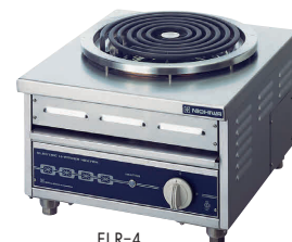
14 電気ローレンジ (卓上タイプ) ELR-4 [EDKO-12] E 納 値 200V

13-0338-1301 ¥292,000 サイズ:500×570×H250 重量:35kg 電源・消費電力:3相200V 6kW ヒーターサイズ:φ400 温度調節:3段切替式 リード線2m・プラグ 接地3P・30A◎