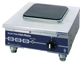
9 電気コンロ THP-3 [EDKO-09] E 納 値 200V

13-0338-0801 ¥114,000 サイズ:580×340×H120 重量:12kg 電源・消費電力:単相200V 3.0kW ヒーターサイズ:φ190×2 リード線2m・引掛プラグ付き 接地2P・20A◎