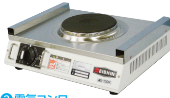
2 電気コンロ NE-100K [EDKO-02] G

13-0338-0101 ¥52,000 サイズ:270×300×H100 重量:4kg 電源・消費電力:単相100V 1kW ヒーターサイズ:φ150 温度調節:6段切替式