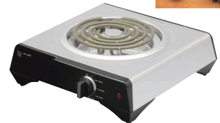
12 シュアークッキングヒーター SK-1200R [EDKO-26] U

13-0338-1801 ¥6,000 サイズ:290×220×H85 重量:約1.4kg(電源コード・五徳含む) 電源:単相100V 50/60Hz 消費電力:600W コード長さ:1.8m スイッチ:3段切替(切・弱/内300W・弱・外 300W・強600W) 適用鍋寸法:底径φ160～φ240 ●毎日の手入れが楽な、ステンレス製ボディを採用 ●鍋やフライパンはもちろん、土鍋や網にも 使用できます。