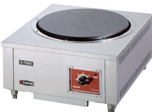
13 電気コンロ NK-6000 [EDKO-11] G 納 値 200V

13-0338-1301 ¥292,000 サイズ:500×570×H250 重量:35kg 電源・消費電力:3相200V 6kW ヒーターサイズ:φ400 温度調節:3段切替式 リード線2m・プラグ 接地3P・30A◎