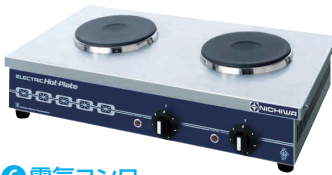
6 電気コンロ THP-1W [EDKO-06] E 納 値

13-0338-0501 ¥51,000 サイズ:270×300×H120 重量:5.8kg 電源・消費電力:単相100V 1kW ヒーターサイズ:φ145 リード線2m・プラグ付き 2P・15A①