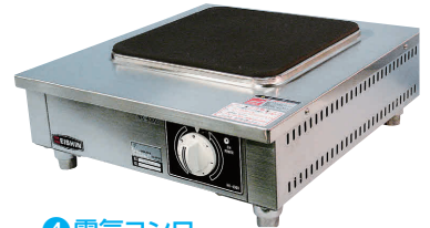
4 電気コンロ NK-4000 [EDKO-04] G 納 値 200V

13-0338-0301 ¥132,000 サイズ:350×400×H170 重量:14kg 電源・消費電力:単相200V 2.6kW ヒーターサイズ:224×224 温度調節:6段切替式