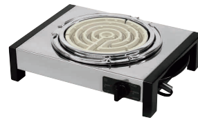
18 シュアー 電気コンロ SK-65V [EDKO-18] △ U

13-0338-1801 ¥6,000 サイズ:290×220×H85 重量:約1.4kg(電源コード・五徳含む) 電源:単相100V 50/60Hz 消費電力:600W コード長さ:1.8m スイッチ:3段切替(切・弱/内300W・弱・外 300W・強600W) 適用鍋寸法:底径φ160～φ240 ●毎日の手入れが楽な、ステンレス製ボディを採用 ●鍋やフライパンはもちろん、土鍋や網にも 使用できます。