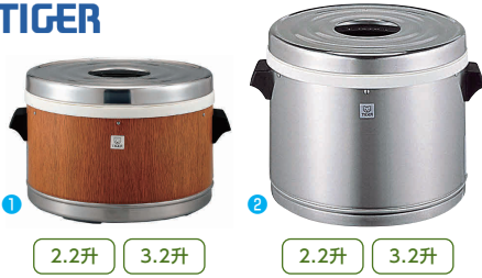
① 2.2升 3.2升 ② 2.2升 3.2升