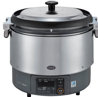
② リンナイ αかまど炊き炊飯器(涼厨) RR-S300G2(3升炊き・フッ素釜) [EGSA-39] K