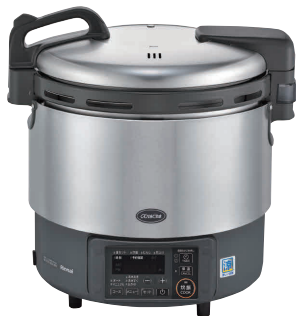
① リンナイ αかまど炊き炊飯器(涼厨) ジャー付 RR-S200GV2(2升炊き・フッ素釜) [EGSA-50] K