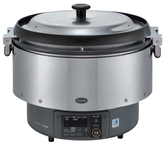
⑤ リンナイ αかまど炊き炊飯器(涼厨) RR-S500G2(5升炊き・フッ素釜) [EGSA-41] K

13-0326-0401 ¥151,800 ガス消費量: 8.37kW 他③と同仕様