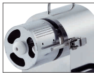
中目オロシドラム