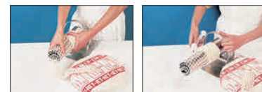
① ネットをホーンにかかかせて、たくしあげます。