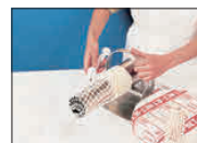
② ホーンの先から2cm余り残して切ります。