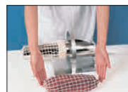
④ ネットを切って出来上がりです。