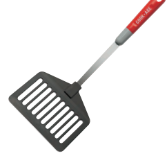
13 クックエイジ ナイロンワイドターナー [BNIL-17] B 13-0198-1301 ¥580 サイズ:115×75 全長295