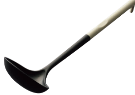
6 ユーノ レードル [BNIL-23] B 13-0198-0601 ¥600 サイズ:92×全長295 容量:約65cc