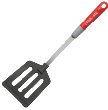
10 クックエイジ ナイロンターナー [BNIL-14] U 13-0198-1001 ¥550 サイズ:73×全長295

クックエイジシリーズ 材質:ハンドル部/ABS樹脂 先端部/66ナイロン 耐熱温度:220°C(ハンドル部80°C)