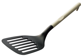
5 ユーノ ハンディーターナー [BNIL-22] B 13-0198-0501 ¥600 サイズ:70×全長293