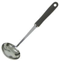
14 スマートシリコングリップ お玉 [BSSG-01] B 洗 サイズ 全長 大(70ml) φ80 285 13-0198-1401 ¥560 小(50ml) φ75 280 13-0198-1402 ¥560

スマートシリコングリップ ● ハンドルがシリコンだからすべりにくく、耐熱性(耐熱温度150°C)に優れ、溶けにくいです。 ● 食器洗い洗浄機&乾燥機に対応しています。