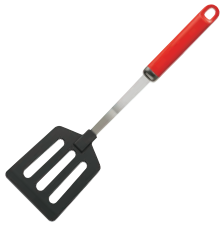
1 フォーラム ナイロンターナー [BNIL-18] B 13-0198-0101 ¥570 サイズ:70×全長300

フォーラムシリーズ 材質:ハンドル部/メラミン樹脂 先端部/66ナイロン 耐熱温度:220°C(ハンドル部120°C)