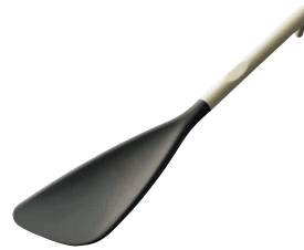
7 ユーノ スパテラ [BNIL-24] B 13-0198-0701 ¥600 サイズ:67×全長302