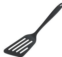
21 TOUCH シリコンバタービーター ブラック G-5083 [BTAN-37] 13-0198-2101 ¥960 サイズ:340×85×H30 重量:97g 材質:表面/シリコンゴム(耐熱温度230°C)、 中芯:ナイロン(耐熱温度170°C)