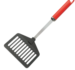
4 フォーラム ナイロンワイドターナー [BNIL-21] B 13-0198-0401 ¥610 サイズ:115×105 全長300