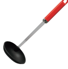
3 フォーラム ナイロンお玉 [BNIL-20] B サイズ 全長 大(90cc) φ95 285 13-0198-0301 ¥610 小(70cc) φ85 285 13-0198-0302 ¥600