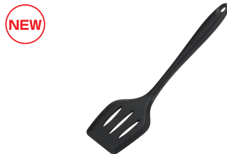
20 TOUCH シリコンターナー 大 (BLACK)G-5082 [BTAN-38] 13-0198-2001 ¥960 サイズ:305×80×H40 重量:97g 材質:表面/シリコンゴム(耐熱温度230°C)、 中芯/ナイロン(耐熱温度170°C)