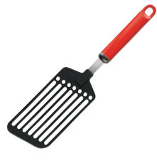
2 フォーラム ナイロンビーター [BNIL-19] B 13-0198-0201 ¥570 サイズ:70×全長300