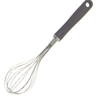
19 スマートシリコングリップ 泡立 [BSSG-04] B 洗 13-0198-1901 ¥560 サイズ:65×全長285