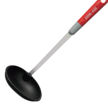
12 クックエイジ ナイロンお玉 [BNIL-16] U サイズ 全長 大(90cc) φ95 260 13-0198-1201 ¥580 小(70cc) φ85 260 13-0198-1202 ¥570