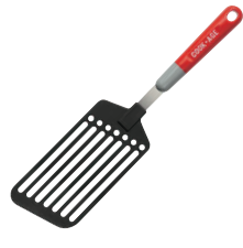
11 クックエイジ ナイロンビーター [BNIL-15] U 13-0198-1101 ¥550 サイズ:70×全長280