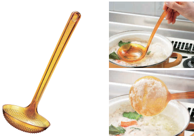
⑬ トータルカラー アク取りお玉

(目盛付) No.2169 [BATO-01] 目 洗 13-0196-1301 ¥1,300 サイズ:φ94×293 材質:ポリエーテルイミド 耐熱温度:-20℃~204℃ ●アクの上にお玉を浸すだけで、突起部分に吸着します。 ●お玉の内側に計量ライン(100、50、30、15、5ml)が付いているので大変便利です。