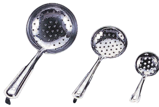
② 18-0 穴明杓子 [BOTA-02]