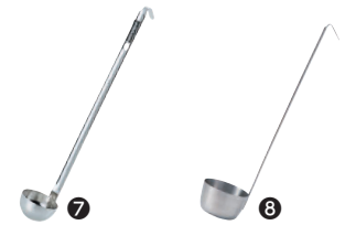
⑦ 18-8 醤油お玉 28cc [BRDL-32]