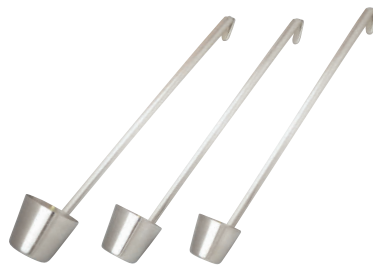
⑤ 18-8 カンロレードル [BKRR-05] △