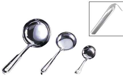
① 18-0 杓子 [BOTA-01]