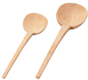
④ 木製 汁杓子 [BOTC-01] 目