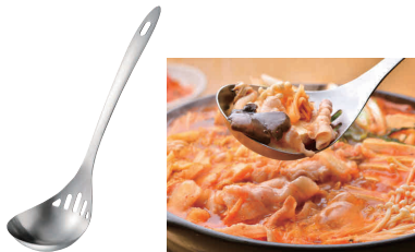
⑨ 18-0 水切りレードル LS1508 [BRDL-26] 目

13-0196-0901 ¥1,800 サイズ:80×全長285 ●柄を傾げるだけでサッと汁が切れます。 ●一体成型なので衛生的です。