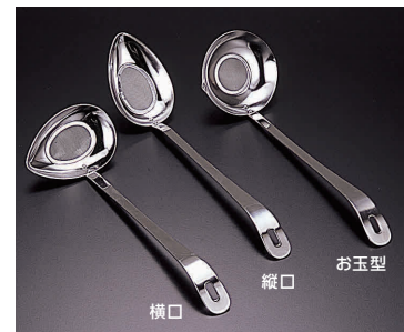
⑫ ステンレス あくとりレードル [BRDL-03]

13-0196-1101 ¥1,300 サイズ:58×全長185 ●汁物おかずのとりわけ時に、傾げるだけでサッと汁が切れます。