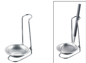
⑮ 18-8 卓上お玉立 FJ2060 [BOTA-23]

13-0196-1401 ¥2,000 サイズ:82×全長290 材質:柄/ステンレス鋼 ヘッド/シリコン樹脂 耐熱温度:300℃ ●お鍋の縁に腰掛け状態で置く事ができるので大変便利です。 ●ほとんどのフタはそのままのせられます。