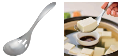
⑩ 18-0 水切りスプーン LS1506 [BRDL-27] 目

13-0196-0901 ¥1,800 サイズ:80×全長285 ●柄を傾げるだけでサッと汁が切れます。 ●一体成型なので衛生的です。