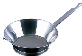
⑬ 18-0 ラーメン用スープ漉し No.4 (50メッシュ) [BSPK-09]