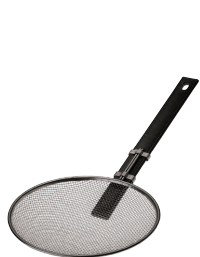
① TSステンレス 樹脂ハンドルそば揚 ヨコ型 (18-8アミ・6.5メッシュ) [ASBA-05] ◇ 目