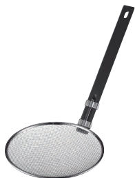
② TSステンレス 樹脂ハンドルそば揚 タテ型 (18-8アミ・6.5メッシュ) [ASBA-10] 目