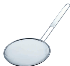
⑫ TSステンレス ラーメンスープこし 極細目(60メッシュ) [BSPK-10] 目