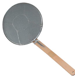
④ 18-8 竹柄そばあげ 縦型 (6.5メッシュ) [ASBA-07]