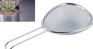
⑰ 讃岐たも用 替え網 [ATMO-02] 目