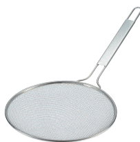
⑥ TSステンレス 共柄すくい網 30cm (18-8アミ・6.5メッシュ) [BSTR-12] 目