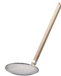
⑤ TSステンレス 木柄 そば揚 厚網 (18-8アミ・6.5メッシュ) [ASBA-03] ◇ 目