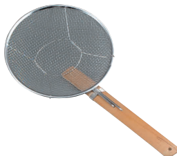
③ 18-8 竹柄そばあげ 横型 (6.5メッシュ) [ASBA-06]