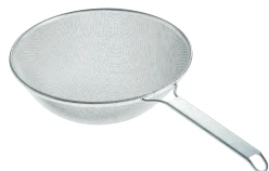
⑦ TS18-8 楽らくそばすくい網 (12メッシュ) [ASBA-11] 目