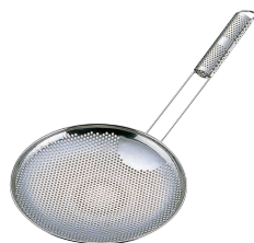
⑨ UK18-8 パンチング そば揚 横型 (穴径:3.0mm) [ASBA-08]