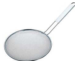
⑭ TSステンレス 背指こし (11メッシュ) [BSPK-06] 目

●網目が細かくラーメン等のスープの仕上げに最適です。 ●どんぶりの上で漉すのに使い易いスタイルです。