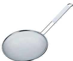
⑪ TSステンレス ラーメンスープこし (24メッシュ) [BSPK-07] 目

特大・大・中 (18-8アミ・14メッシュ) 小 (18-8アミ・12メッシュ)