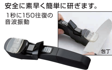
⑩ ファインシャープナー SS-30 [CSYN-01] E

13-0140-0901 ¥2,200 サイズ:158×58×H57 重量:60g ●包丁を前後に10回程度往復させるだけで、荒研ぎと仕上げ研ぎが一度にOK。 ※両刃専用