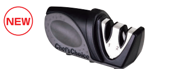
⑲ シェフスチョイス 手動式コンパクト 包丁砥ぎ器 476 グレー [CSYN-22] △ G

13-0140-1401 ¥4,500 サイズ:205×75×H75 ●荒砥(#320)と中砥(#1000)の2種類の砥石を内蔵。 ●本体に耐久性に優れた18-8ステンレス鋼を採用。 ●摩耗した砥石は交換可能です。 ※波刃、片刃には使用できません。