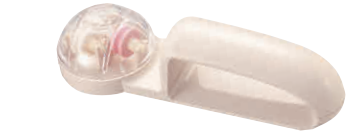
⑰ 包丁とぎ器 ウォーターシャープ M-150 [CSYN-08] G

13-0140-1601 ¥3,000 サイズ:210×36×H55 材質:砥石部分/アルミナセラミック 荒砥石 #100 中砥石 #180 仕上げ砥石 #400 ●荒研ぎ(水色)、中研ぎ(白色)、仕上げ研ぎ(ピンク色)が1台で出来ます。 ※両刃専用