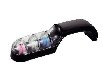
⑯ 包丁とぎ器 ウォーターシャープⅢ M-151 [CSYN-09] U

13-0140-1501 ¥4,800 サイズ:53×200×H65 材質:本体/ABS ディスク/アルミナ(セラミック) ●ワンタッチ式の大形切替えボタンにより、「研ぎ直し」と「仕上げ」を行う事ができます。 ※両刃専用