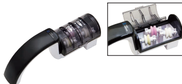
⑪ トリプルシャープナープロ KC-303 [CSYN-15] E

13-0140-1001 ¥4,200 サイズ:202×38×H57 重量:135g 電源:単3乾電池×2本(別売) 材質:砥石部分/ファインセラミック ●1秒に約150往復の音波振動で素早く砥ぐ! ※両刃専用