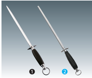
① ナイフシャープナー(スチール棒) 細目 [CSTL-11]