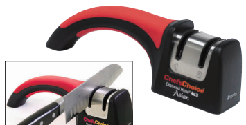
⑦ シェフスチョイス マニュアル 包丁研ぎ器 463 [CSYN-07] G

13-0140-0701 ¥7,800 サイズ:215×55×H70 ●ダイヤモンド研磨剤使用 ●短時間で簡単に、お手持ちの包丁にすばらしい切れ味を提供します。 ●粗研ぎと仕上げ研ぎが一台でできます。 ※両刃専用 ※セラミック包丁、片刃包丁、ハサミ、工具などには使用できません。