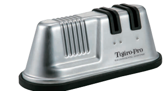
⑭ Tojiro・Pro シャープナー F-641 [CSYN-13] U

13-0140-1301 ¥3,800 サイズ:196×43×H43 ダイヤ/セラミックローラー粒度#1000 平角砥石粒度#1000 ●シンプルで堅牢なステンレスボディのシャープナーです。