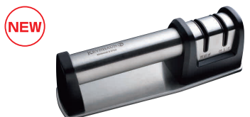
⑱ ケヴン・ハウン シャープナー KDS.305 [CSYN-23] △ E

13-0140-1101 ¥5,000 サイズ:200×60×H70 砥石:荒砥石#150(両刃用)、中砥石#320(両刃用)、仕上げ砥石#600(両刃片刃兼用) ●荒砥ぎ、中砥ぎ、仕上げ研ぎがこれ一台でできます。 ●刃先を追従し滑らかに研げるサスペンション機能搭載。