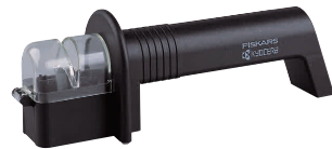
⑧ セラミックロールシャープナー RS-20-FP [CSYN-02] E

13-0140-0701 ¥7,800 サイズ:215×55×H70 ●ダイヤモンド研磨剤使用 ●短時間で簡単に、お手持ちの包丁にすばらしい切れ味を提供します。 ●粗研ぎと仕上げ研ぎが一台でできます。 ※両刃専用 ※セラミック包丁、片刃包丁、ハサミ、工具などには使用できません。