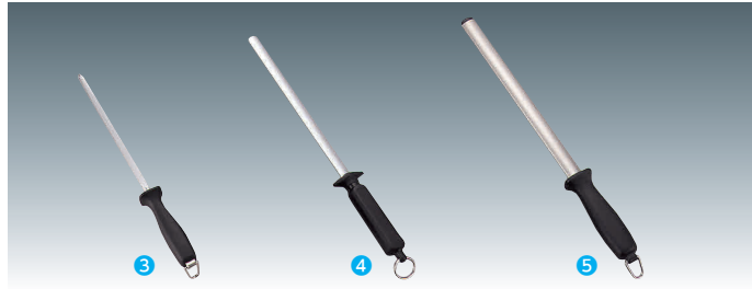
③ ヴォストフ スチール棒丸 4460-23 [CSTL-03] G