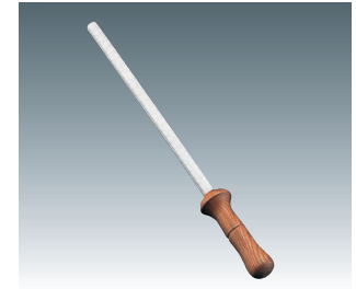
⑥ グレステン シャープナー [CSTL-02] G