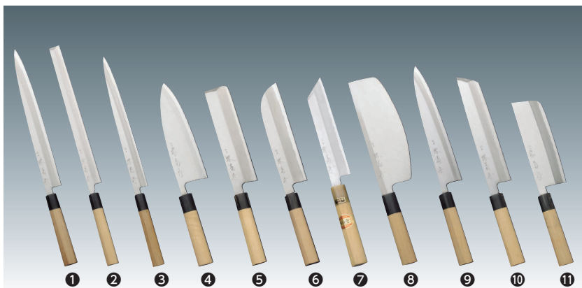
白二鋼。水牛柄（口金）付、本霞研です。 ※左用は受注生産の為、定価が1.5倍となります。

プロ用霞和包丁の決定版。堺菊守が自信を持ってお届けします。研ぎやすく切れ味の持続性にも優れています。今までの霞和包丁に納得が行かなかった方にお勧めです。