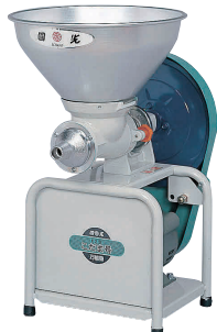
4 こだま号万能機 K2-BMS(M) (全アタッチ付) [EBNK-01] M

13-0102-0301 ¥8,500 サイズ:245×250×H360 ホッパーサイズ:236×167 最大容量:5.4ℓ(3升) 重量:1.2kg カラー:ホワイト(W) ●つきたてのお餅がくつきにくい、「フッ素加工」のナイフ ●一度に5.4L(3升)のお餅が入る大容量ホッパー ●吸着盤つきスタンド