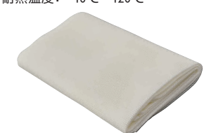
17 ホテイ印 テトロン モチフキン (5枚入) [AMTF-05]

サイズ 大 780×750 13-0102-1601 ¥8,500 小 640×620 13-0102-1602 ¥6,200 材質:綿100% ●生地離れが良く、使いやすい。