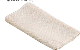
16 ホテイ印 純綿モチフキン (5枚入) [AMTF-03] △

13-0102-1501 ¥5,600 サイズ:外寸/φ506×H72 内寸/φ480×H70 容量:15ℓ