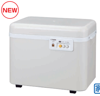
20 タイガー 餅つき機 カじまん SMG-A361 [EMTK-08] S

13-0102-1901 ¥42,000 サイズ:432×412×H370 電源:単相100V 50/60Hz 消費電力:270W もちつき可能量:3.6~5.4ℓ(2~3升) 重量:10.3kg 付属品:餅とり器