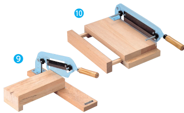
9 かきもち切り器 A-0800 [EMTC-01] B

サイズ kg 直 電 大 φ97×430×全長900 3.8 13-0102-0801 ¥19,800 小 φ70×430×全長900 2.2 13-0102-0802 ¥14,900 材質:本体/ポリエチレン樹脂 柄/天然木 ●ポリエチレン樹脂を使用しているため、木くずやささくれの混入を防ぎます。