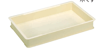
12 トンボ PPフードコンテナ [ABJC-05] ◇ B

サイズ フードコンテナ用 360×560 13-0102-1101 ¥1,000 のし板用 880×1,200 13-0102-1102 ¥3,000 材質:ポリプロピレン(耐熱100℃) ●もちがくつきにくく、コンテナの後片づけも楽になります。