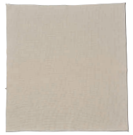
18 ホテイ印 まんじゅう蒸しふきん 厚地 [AMTF-04] ◇

13-0102-1701 ¥9,800 サイズ:700×700 ●耐熱性、生地の変色に強いテトロン糸製。