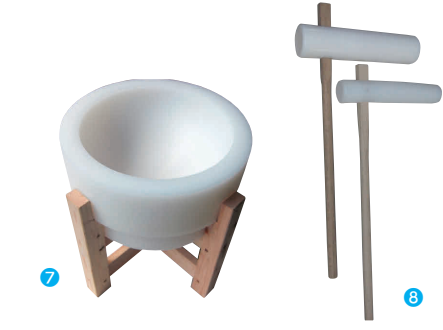
7 PC 臼 (木台付) [EMUS-04] J

サイズ 重量(kg) 直 電 大 φ118×350×H850 3.5 13-0102-0601 ¥22,700 小 φ85×332×H850 1.8 13-0102-0602 ¥17,700 ※杵の形状は頭部が角型になる事もあります。