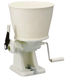
3 タイガー 餅切り(まる餅くん) SMX-5401 [EMCT-01] S

13-0102-2001 ¥44,500 サイズ:454×312×H350 電源:単相100V 50/60Hz 消費電力:モーター/230W(50Hz)・260W(60Hz) ヒーター/830W もちつき可能量:3.6ℓ(2升) 重量:10.5kg