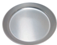
15 アルミ もちとり盆 48cm シルバー [AMTB-02]

13-0102-1501 ¥5,600 サイズ:外寸/φ506×H72 内寸/φ480×H70 容量:15ℓ