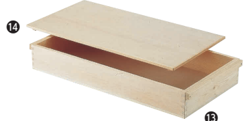
13 木製 餅箱(唐椀) [AMTB-03] ◇

サイズ 洗 大 外寸:575×350×H80 13-0102-1201 ¥1,630 内寸:535×320×H70 小 外寸:540×335×H75 13-0102-1202 ¥1,160 内寸:505×305×H65 耐熱温度:-10℃~120℃