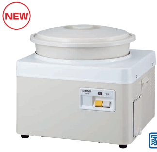
19 タイガー 餅つき機 カじまん SME-A541 [EMTK-06] S

13-0102-0101 ¥33,000 サイズ:250×355×H275 電源:単相100V 50/60Hz 消費電力:モーター/142W(50Hz)・160W(60Hz) ヒーター/600W もちつき可能量:0.9~1.8ℓ(5合~1升) 重量:7.5kg ●「蒸す」「つく」「こねる」「つぶす」の1台4役!