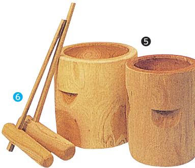
5 臼(ウス) (国産ケヤキ材) [EMUS-01]

13-0102-0401 ¥134,000 サイズ:390×480×H670 重量:30kg 電源:単相100V 50/60Hz 消費電力:400W ホッパー容量:13ℓ φ360 能力:製餅4.2kg(3升)/5分 製粉6~50kg/時間 味噌すり・大豆200kg/時間 ●1台で多目的にご利用頂ける多機能タイプです。