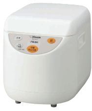
1 象印 もちつき機 カもち BS-ED10 [EMTK-07] S

13-0102-0101 ¥33,000 サイズ:250×355×H275 電源:単相100V 50/60Hz 消費電力:モーター/142W(50Hz)・160W(60Hz) ヒーター/600W もちつき可能量:0.9~1.8ℓ(5合~1升) 重量:7.5kg ●「蒸す」「つく」「こねる」「つぶす」の1台4役!