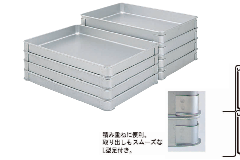
積み重ねに便利、取り出しもスムーズなL型足付き。