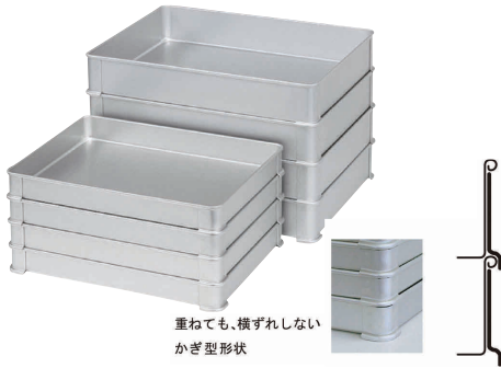
重ねても、横ずれしないかぎ型形状