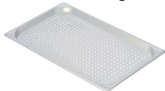
⑨ マイスター アルミ 穴明ホテルパン [AHTP-20]