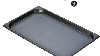
⑩ マイスター アルミノンスティック ホテルパン [AHTP-17]