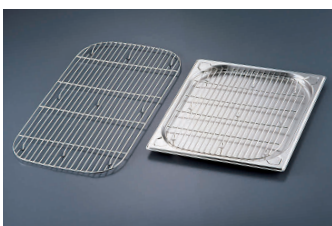
⑤ KYS 18-8 ガストロノームパン用 敷アミ(焼網) [AGNA-03]