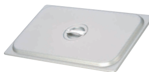
⑦ マイスター アルミ ホテルパン用 フタ [AHTP-21]