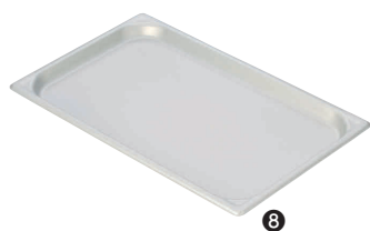
⑧ マイスター アルミ ホテルパン [AHTP-19]