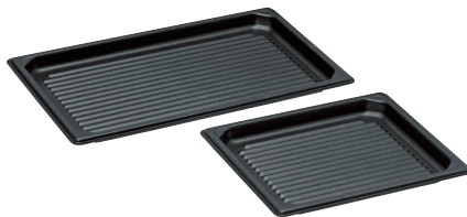
② KYS アルミノンスティック ガストロノーム ウェーブパン [AAGN-06]