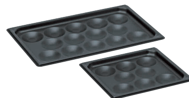
③ KYS アルミノンスティック ガストロノーム エッグパン [AAGN-07]