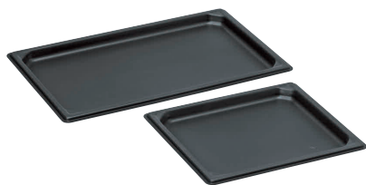
① KYS アルミノンスティック ガストロノーム フラットパン [AAGN-05]

● 熱伝導に優れたアルミニウム製！ フッ素樹脂加工を施しているので簡単に洗浄できます！