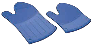
④ シリコンラバーオープンミット (1枚) [AOMT-23] △ 洗