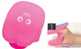
⑦ つかみ上手2個セット(ミトン) NMT-SET-P(ピンク) [AOMT-22] △ 洗