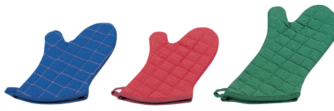
⑫ カラーオープンミット(1枚) [AOMT-20] △