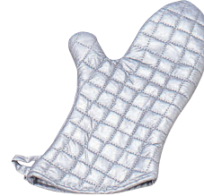
③ シリコンオープン手袋(1枚) [AOMT-19] △