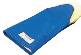
⑨ バンガード オープンプレスミット (高温用)(1枚) [AOMT-14] △