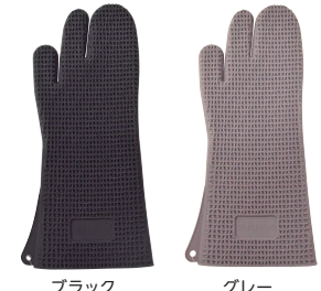
⑥ シリコマート シリコングローブ ACC082 [AOMT-29] △