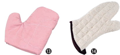
⑬ ポロ手袋(2枚1組) [AOMT-08] △