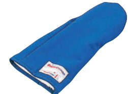
⑩ バンガード オープンパピット ミット(1枚) [AOMT-15] △