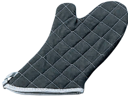
① フレームガード オープンミット ブラック(1枚) [AOMT-17] △