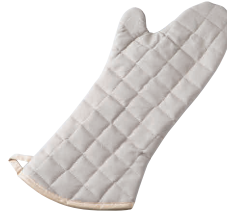
② フレームガード オープンミット タン(1枚) [AOMT-18] △