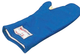
⑧ バンガード オープンミット (1枚) [AOMT-13] △