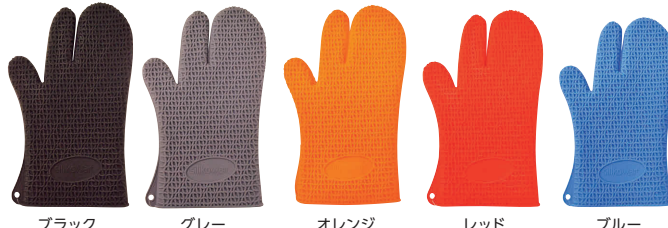
⑤ シリコマート シリコングローブ ACC072 [AOMT-25] △