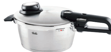
⑭ フィスラー ビタビットプレミアム 圧力鍋 [AATN-38] IH

内径×高さ kg 商品番号 価格 1.8ℓ 180×H140 2.0 13-0018-1401 ¥44,000 2.5ℓ 180×H165 2.4 13-0018-1402 ¥47,000 3.5ℓ 220×H160 3.1 13-0018-1403 ¥49,000 4.5ℓ 220×H185 3.2 13-0018-1404 ¥50,000 6.0ℓ 220×H235 3.4 13-0018-1405 ¥55,000