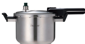
⑤ ワンダーシェフ Pro2 片手圧力鍋 6ℓ [AATN-37] IH

内寸 炊飯 豆(ℓ) kg 商品番号 価格 8ℓ φ230×H190 1升 2.6 3.19 13-0018-0401 ¥49,000 10ℓ φ230×H240 1升 3.3 3.35 13-0018-0402 ¥53,000 ●目皿付