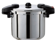
④ ワンダーシェフ プロ業務用圧力鍋 [AATN-28] IH

内寸 炊飯 豆(ℓ) kg 商品番号 価格 15ℓ φ280×H242 1.5升 5.0 5.9 13-0018-0301 ¥107,000 20ℓ φ280×H320 1.5升 6.6 6.2 13-0018-0302 ¥116,000 ●取扱はステンレスキャスト製で清潔・強固です。