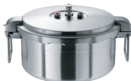
② ワンダーシェフ 業務用プロビッグ 浅型 16ℓ [AATN-19] IH

13-0018-0101 ¥187,000 サイズ:内径φ345×H330 重量:8kg 白米炊飯量:1升5合 豆類線:約10.0ℓ ●業務用のビッグサイズ。 ●持ちやすいワイヤーハンドル仕様。