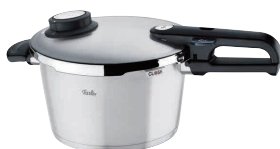
⑧ フィスラー プレミアム圧力鍋 4.5ℓ [AATN-15] IH

13-0018-0801 ¥58,000 サイズ:220×H137 重量:2.6kg 付属品:蒸し器・三脚・料理ブック ●低圧から高圧、そして超高圧まで、圧力の細かい設定が可能。 ●蒸し料理用に、圧のかからないスチーム機能付