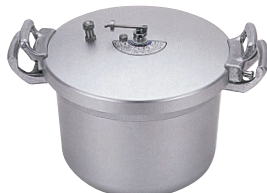
⑪ ホクア 業務用アルミ圧力鍋 [AATN-02] IH

サイズ ℓ kg 商品番号 価格 SHP-16 φ500×307×298 16 5.0 13-0018-1001 ¥144,000 SHP-22 φ562×375×342 22 8.0 13-0018-1002 ¥161,000 材質:アルミニウム合金 ●肉類、魚介類、野菜スーベースの煮込み、製餡および味噌製造工程における豆類の下煮、シチュー、グラッセ、コンポートなどの煮込み全般、蒸し物、茹で物に対応。