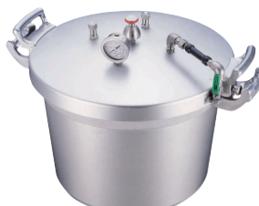
⑫ アルミ 業務用圧力鍋(第2安全装置付) [AATN-03] LH

内径×高さ 最大炊量 kg 商品番号 価格 15ℓ 360×162 2.0升 8.9 13-0018-1101 ¥110,000 18ℓ 360×192 2.4升 9.5 13-0018-1102 ¥140,000 21ℓ 360×228 2.7升 9.7 13-0018-1103 ¥170,000 24ℓ 360×260 3.0升 10.1 13-0018-1104 ¥160,000 材質:アルミキャスト製 底厚:7.0 安全フィルター付 ※最大炊量は米の炊き量です。