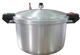
⑩ 業務用圧力鍋 SHP [AATN-23] LH

サイズ ℓ kg 商品番号 価格 SHP-16 φ500×307×298 16 5.0 13-0018-1001 ¥144,000 SHP-22 φ562×375×342 22 8.0 13-0018-1002 ¥161,000 材質:アルミニウム合金 ●肉類、魚介類、野菜スーベースの煮込み、製餡および味噌製造工程における豆類の下煮、シチュー、グラッセ、コンポートなどの煮込み全般、蒸し物、茹で物に対応。