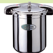
③ ワンダーシェフ 業務用プロビッグ 圧力鍋 [AATN-07] ◊ IH

13-0018-0201 ¥113,000 サイズ:内径φ345×H165 重量:7.2kg 白米炊飯量:22合 豆類線:約5.3ℓ ●浅型大口径なので魚など重ね煮出来ない調理もおまかせ ●持ちやすいワイヤーハンドル仕様。