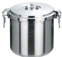
① ワンダーシェフ 業務用プロビッグ 圧力鍋 30ℓ [AATN-08] ◊ IH

13-0018-0101 ¥187,000 サイズ:内径φ345×H330 重量:8kg 白米炊飯量:1升5合 豆類線:約10.0ℓ ●業務用のビッグサイズ。 ●持ちやすいワイヤーハンドル仕様。