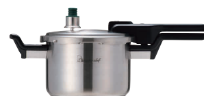
⑥ ワンダーシェフ Pro2 片手圧力鍋 3ℓ [AATN-17] ◊ IH

13-0018-0501 ¥20,000 サイズ:内径φ220×H160 重量:2.6kg 底径:φ220 白米炊飯量:約7合 豆類線:約2.0ℓ ●本体に近いハンドル部分はステンレス製で焼け焦げにくく、丈夫です。 ●焦げ付きにくい底三層構造。