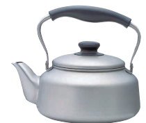
⑯ 柳宗理 18-8 IHケトル 2.5ℓ