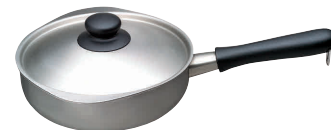
⑮ 柳宗理 IH片手鍋(つや消し)

サイズ:290×180×H107(深さ70) 容量:1.2ℓ 重量:0.43kg