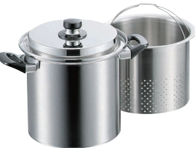
④ エレックマスターライトパスタポット 20cm