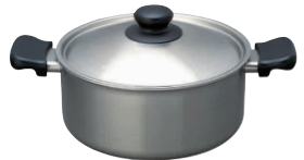
⑨ 柳宗理 18-8 両手鍋 浅型

サイズ:347×237×H207(深さ155) 容量:6.0ℓ 重量:1.5kg