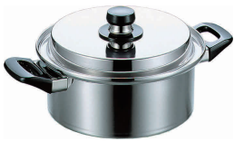
① エレックマスターライト両手鍋 20cm