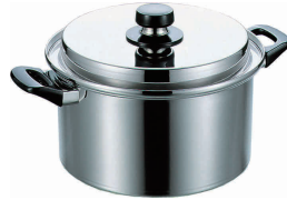
② エレックマスターライト深型両手鍋