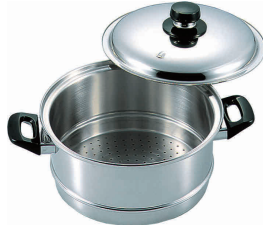
⑤ エレックマスターライトセイコ(蓋付) 24cm