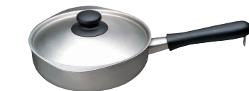
⑩ 柳宗理 18-8 片手鍋

サイズ:347×237×H207(深さ155) 容量:6.0ℓ 重量:2.06kg 材質:ステンレス・アルミ三層鋼