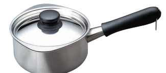
⑫ 柳宗理 18-8 ミルクパン