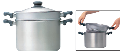
⑪ 柳宗理 ステンレスパスタパン