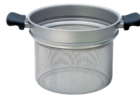
⑬ 柳宗理 ステンレスコランダー

サイズ:347×237×H147(深さ98) 容量:3.8ℓ 重量:1.27kg