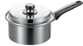
③ エレックマスターライト片手鍋