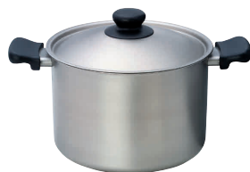
⑭ 柳宗理 IH両手鍋 深型

●⑧・⑨にセットすることでパスタパンとして使えます。 ●1枚の板から作られるので、網目もつたたり、ほどけたりしません。軽くて丈夫です。