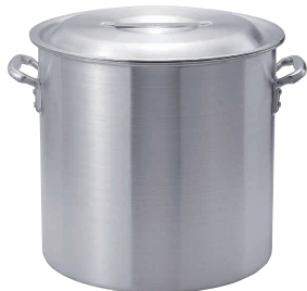
① KYS アルミ寸胴鍋 (目盛付) [AZUB-03]