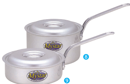
⑧ アルミ マイスター 片手鍋 [AKFB-03] V