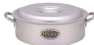
⑦ アルミ マイスター 外輪鍋 [ASWB-03] V