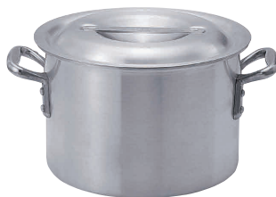
② KYS アルミ半寸胴鍋 (目盛付) [AHZB-03]