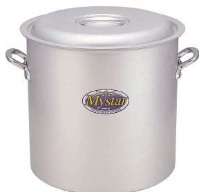
⑤ アルミ マイスター 寸胴鍋 [AZUB-04] V