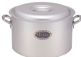
⑥ アルミ マイスター 半寸胴鍋 [AHZB-04] V