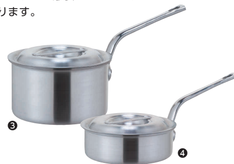
③ KYS アルミ片手鍋 (目盛付) [AKFB-04]