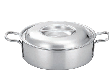
⑥プロデンジ 外輪鍋 [ASWA-02] U IH