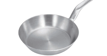
⑩プロデンジ フライパン [AFPA-03] U IH