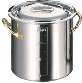
①クラッド 目盛付寸銅鍋 [AZUA-02] IH