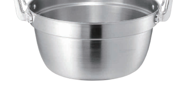
⑪プロデンジ 段付鍋 [ARYA-02] △ U IH