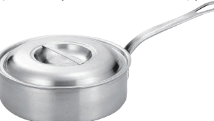
⑧プロデンジ ソテーパン [AKAA-02] U IH