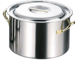
②クラッド 半寸銅鍋 [AHZA-02] IH