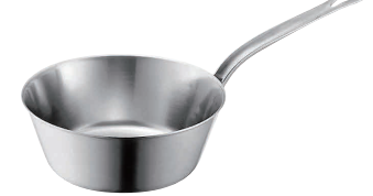
⑨プロデンジ テーパーパン [ATEP-01] U IH