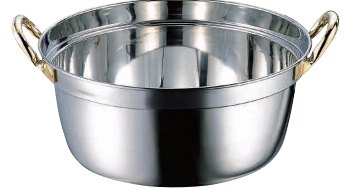
③クラッド 段付鍋 [ARYA-01] △ IH