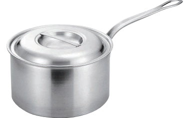
⑦プロデンジ シチューパン [AKFA-02] U IH