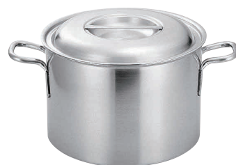
⑤プロデンジ 半寸銅鍋 [AHZA-03] U IH