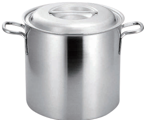
④プロデンジ 寸銅鍋 [AZUA-03] ◇ IH

底板厚: 15cm/2.0mm 18cm・21cm/2.5mm 24cm以上/3.0mm