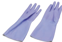
⑧ ダンロップ 手袋 デジハンド ソフト バイオレット

材質:ニトリルゴム ●化学的に強化した表面処理とエンボス状のすべり止め ●No.275のみ裏綿植毛付