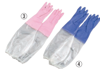
③ シルキー 厚手 手袋 腕カバー付

材質:塩化ビニール樹脂 ●抗菌防臭加工付き、手袋の表面に強力なすべり止め特殊加工がしてあります。