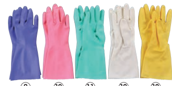
⑨ ⑩ ⑪ ⑫ ⑬ ビニール厚手手袋 ソフトエース 加

材質:表/天然ゴム、裏/ナイロン100% ●極細18ゲージ編手が柔らかく手にフィットします。 ●表面特殊処理加工によりグリップ性に優れています。