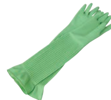
⑥ シンガー 天然ゴム厚手手袋 スーパーロング 加

材質:ニトリルゴム ●油・洗剤等に強い ●やわらかく使いやすい裏毛付 ●ラテックスアレルギーの元となるタンパク質を含んでいません。