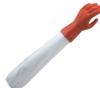
② ショーワ ニュービニローブ 手袋 腕カバー付 No.645

材質:塩化ビニール、 非フタル酸エステル系可塑剤 ●肩口までのロングタイプで腕全体を保護します。 ●指部分はスリ落ちを防止するゴムバンド付きです。 ●手袋部分は薄手でフィット感に優れ、指先感覚が活かされます。