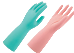
⑤ ショーワ ニトリルゴム製手袋 中厚手 No.139 加