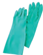
⑦ ニトリル手袋 ソルベックス 加