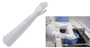
① ショーワ 腕カバー付薄手 No.240 加