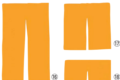
半間用 無地 のれん あかね