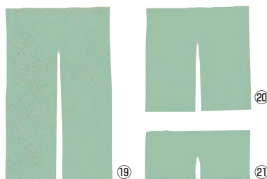
半間用 無地 のれん グリーン