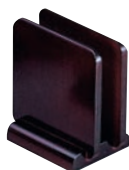
⑨木製 メニュー立て ブラウン