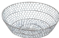
⑫ 手あみ ステンレス 紙鍋用受籠

EBM 18-8 紙鍋ホルダーは P1795-⑪ EBM アルミ コンロセット 小 6-1796-1102 3283300 ¥1,900 とご使用いただけます。