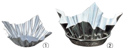
① アルミすき鍋 銀 (100枚入)

このページの紙すき鍋には ① 紙鍋ホルダー 6-1796-1101 1685400 ¥950 をご使用ください。