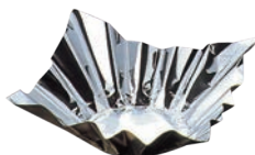
③ アルミ箔鍋 金／銀 (200枚入) 8号 切