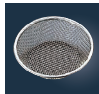
⑪ EBM 18-8 紙鍋ホルダー