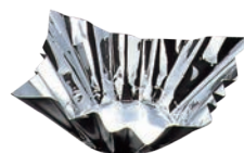
④ アルミ箔鍋 銀 (200枚入) 8号 切