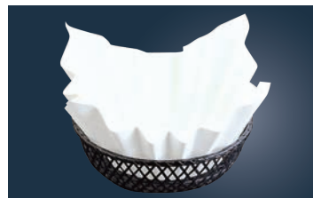
⑥ 紙すき鍋 奉書 (300枚入)