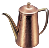
⑥銅 槌目入 コーヒーポット