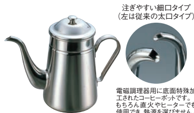
①EBM 18-8 電磁対応 コーヒーポット 細口