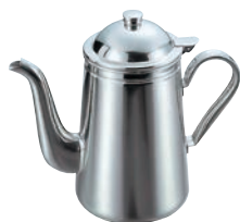
③EBM 18-8 蝶番付コーヒーポット