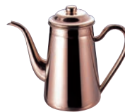
⑦銅 コーヒーポット