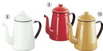
キリン印 ホロー コーヒーポット