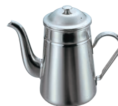
②EBM 18-8 電磁対応 コーヒーポット 太口