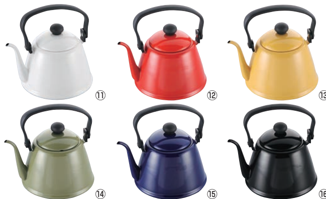
ホロー ドリップケトルⅡ DK-200