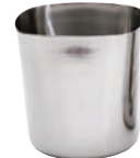
③KM ステンレス フライドポテトカップ ミラー ㊦