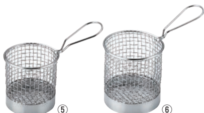
KM ステンレス ミニ 丸型フライバスケット ㊦