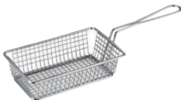
④KM ステンレス サービングバスケット ㊦