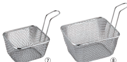
KM ステンレス ミニ 角型フライバスケット ㊦