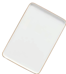
⑤陶器 角ケーキトレイ