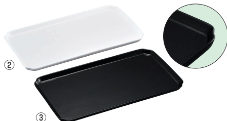
陶磁器 角ケーキプレート測無