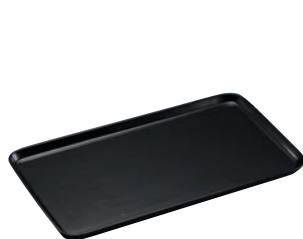
①陶磁器 角ケーキプレート