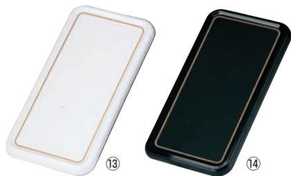
メラミン陶器風 ケーキトレイ