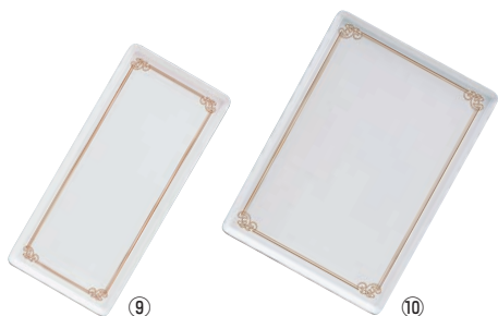
メラミン陶器風トレイ