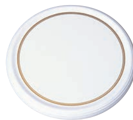
⑮メラミン陶器風ケーキトレイ