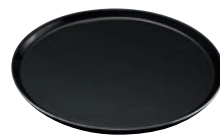
④陶磁器 丸ケーキプレート