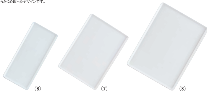
メラミン陶器風トレイ