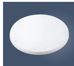
⑧PC トラクタ クールスタンド (回転台) No.1732 小