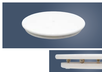
⑩人工大理石 回転台

外寸:φ310×H140 材質:本体/ABS樹脂、Uピン/18-8ステンレス ●ケーキ側面のデコレーションがきれいにできます。 ●スタンド式なのでケーキを置く位置が高く、デコレーションしやすいです。