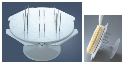
⑨PC デコレーション スタンド (ピン付) No.1325