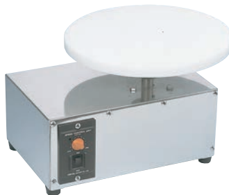
⑤電動 ジュラコン 回転台

ネジが支柱の凹にハマリ、天板を持ってもスタンド部がはずれません。(30cmのみ) ※あまり強く締めると回転が悪くなります。