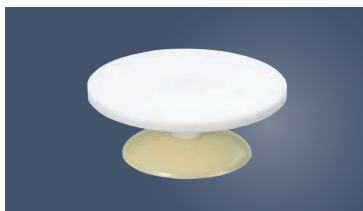
④ジュラコン 回転台