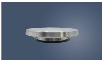
②ステンレス 回転台