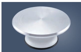
①アルミ鋳物 デコ回転台 4157