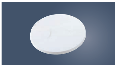
⑦PC クールスタンド (回転台)