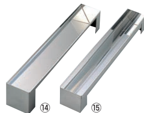
⑭⑮ デバイヤー 18-0 取りはずし式 トヨ型