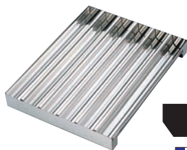
⑯ デバイヤー 18-10 マティノックス モール・ア・ブッシュ オクタゴン 6連 4582.02