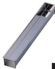
⑨18-0 羊かん トヨ型 角型