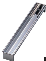
⑪18-0 羊かん トヨ型 半月