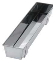
⑧EBM 18-0 トヨ型 角