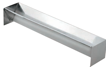
⑱ KM 18-8 トヨ型 V型