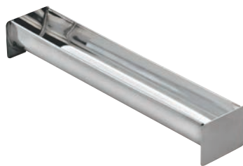
⑰ KM 18-8 トヨ型 U型