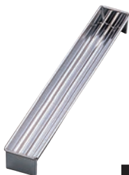
⑬18-0 羊かん トヨ型 ミツ山