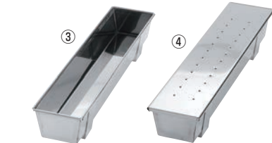
③EBM 18-0 足付 角 トヨ型 蓋無