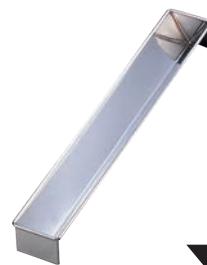
⑩18-0 羊かん トヨ型 三角