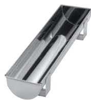
⑦EBM 18-0 トヨ型 丸