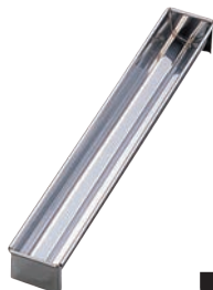
⑫18-0 羊かん トヨ型 栗