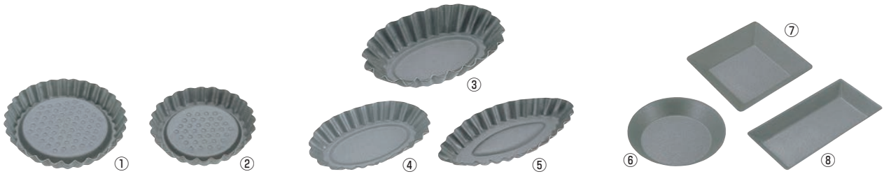
①タルトレット丸 中