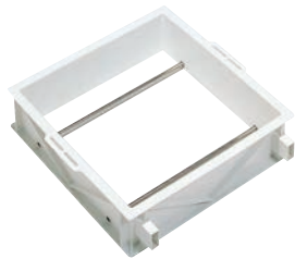
⑤ サンコー せいろう せいろう1型

Check! 特長(1)プラスチック製なので断熱性に優れ、保温性結露性は木製と殆ど変わりません。 特長(2)耐摩耗性と耐衝撃性に優れていますから、セイロの角が欠けたり、削れたりして食品に混入する恐れがなく安心です。 特長(3) 棧がステンレス製なので錆びにくく丈夫です。