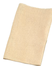
⑧ ホテイ印 綿モチフキン (5枚入)