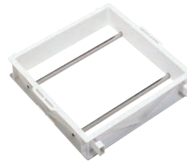
⑥ サンコー せいろう せいろう2型