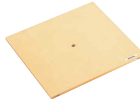
③ 抗菌角セイロ 台す