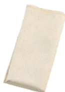
⑩ ホテイ印 綿 まんじゅうフキン (10枚入)