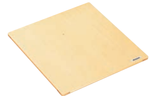
④ 抗菌角セイロ 平蓋