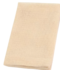
⑪ プロユーザーの蒸し器ネット