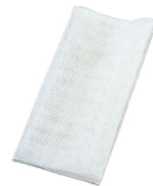
⑨ ホテイ印 テロンモチフキン (5枚入)