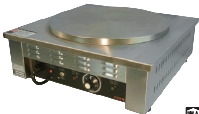
エイシン 電気 クレープ焼器 (一連) 納期