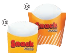
スナックカートン 黄