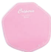
⑩クレープ包装紙 デリシャス(変形) 200枚入 ピンク