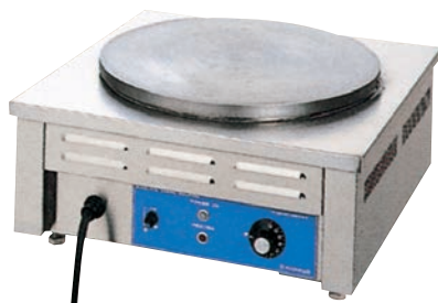
電気 クレープ焼器 納期