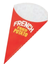
⑯三角ポテト袋 01452 大 (3,000枚入)