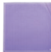
⑪クレープ包装紙 デリシャス(四角) 200枚入 パープル