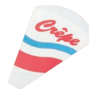
⑫クレープ袋 01461 (2,000枚入)