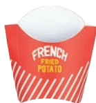
⑮フレンチポテトカートン 01384 (50枚入)