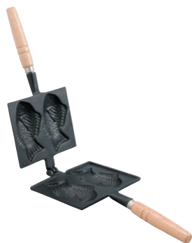
①鉄 たい焼器 418 切

ページコード 商品コード 価格 6-0862-0101 7820710 ¥7,500 外寸:165×140×335 1個の大きさ:約65×110 重量:1.6kg ●具材がこぼれにくいようふちを高く設計しました。