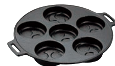
④アサヒ 鉄イモノ 巴焼器 切 A815-17

ページコード 商品コード 価格 6-0862-0301 7819701 ¥6,000 外寸:175×200×380(木柄含む) 重量:2.3kg 材質:鉄イモノ ●具材がこぼれにくいよう工夫しました。