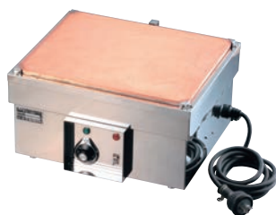
⑥電気ホットプレート