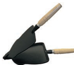
③鉄 いか焼器 切

ページコード 商品コード 価格 6-0862-0201 1842900 ¥7,700 外寸:165×370×H40 1個の大きさ:約120×65 重量:1.6kg