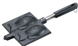
②南部鉄 たいやき 切

ページコード 商品コード 価格 6-0862-0101 7820710 ¥7,500 外寸:165×140×335 1個の大きさ:約65×110 重量:1.6kg ●具材がこぼれにくいようふちを高く設計しました。