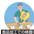
食品加工での検査に

ページコード 商品コード 価格 TY-30K 6-0792-0801 8361100 ¥85,000 外寸:55×245×H57 重量:340g 電源:単3乾電池(1.5V)2本 探知幅:ワイド/40×90、スポット/35×30 ●食品(魚介類、山菜、野菜)などに混入した金属を探知 ●深知部はワイド・スポットの2レンジ切替 ※探知できる材質は鉄製に限られます。