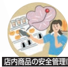
店内商品の安全管理に