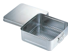
④AG 18-8 天ぷらバットセット