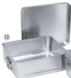
⑬18-8 天ぷら入 コンテナ(蓋付) ㊦