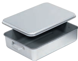
②アルマイト天ぷら入 B型(蓋付) ㊦