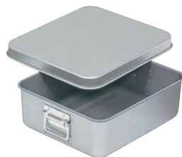
③アルマイト天ぷら入 (蓋付) コンテナ用 ㊦