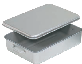
①アルマイト天ぷら入 A型(蓋付) ㊦