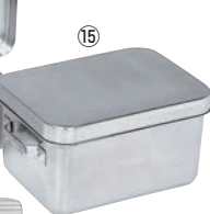
⑮18-8 天ぷら入 ミニ容器(蓋付) ㊦