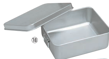
⑱アルマイト保温・保冷バット (蓋付) コンテナ用 ㊦