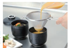
茶碗蒸し作りでとき卵がきれいにこせ、まるやかさアップ