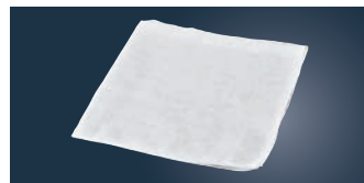
⑧EBM カットガーゼ (10枚入)

ページコード 商品コード 価格 6-0601-0701 7345000 ¥1,600 幅30cm×10m巻 材質:綿100%