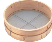
⑦木枠 ステン張 砂糖フルイ