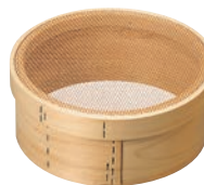
⑥木枠 銅張 パン粉フルイ