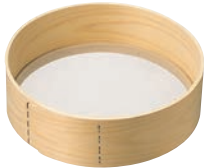
①木枠 ステン張 粉フルイ