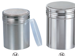
⑭18-8 ポリエチレン蓋付 パウダー缶

材質:本体/ポリエチレン 蓋/18-8ステンレス 付属品:ポリキャップ付 28メッシュ