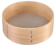
④木枠 ステン張 そば粉フルイ