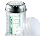
⑱粉糖振り器 (カバー付)

●目盛りが付いているので、計量したまま、粉・粉糖がふるえ、上面が網になっているのでまんべんなくふるえます。