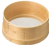
⑤木枠 ステン張 パン粉フルイ