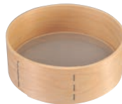
②木枠 ステン張 粉フルイ 細目