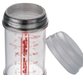
⑰粉糖ふり (カバー付)

外寸:φ72×H104 材質:18-8ステンレス 容量:約280ml 穴径1.4mm