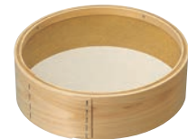
③木枠 真鍮張 粉フルイ