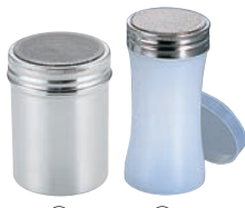
⑫UK 18-8 パウダー缶

φ120×213×H94 材質:本体/ABS樹脂 アミ/ポリプロピレン 18メッシュ