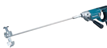
⑭マキタ カクハン機

⑫190×77×H200 ⑬201×97×H196 電源:単相100V 50/60Hz 定格時間:10分 コード:約1.7m 重量:740g ●スピードが5段階で調整可能(ワイヤービーター付) ●中心に芯がなく洗いやすいビーター形状 ●ビーターをつけたまま本体を立てられるので汚れにくいです。 ●ワンタッチでビーターが簡単に取り外せます。