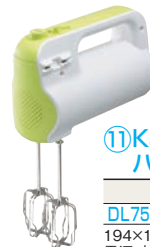
⑪KaiHouse SELECT ハンドミキサー ターボ付