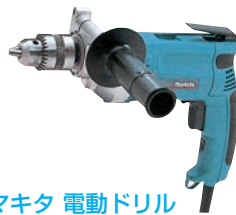
⑰マキタ 電動ドリル