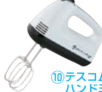
⑩テスコム ハンドミキサー THM273