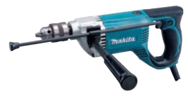
⑲マキタ 電動ドリル