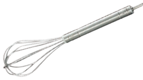
⑯ステンレス電動ドリル用泡立器