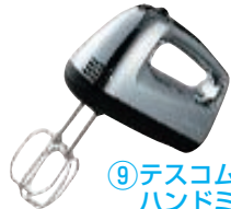
⑨テスコム ハンドミキサー THM1300