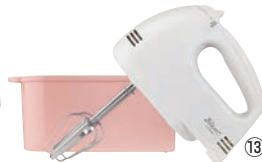
ドリテック ハンドミキサー