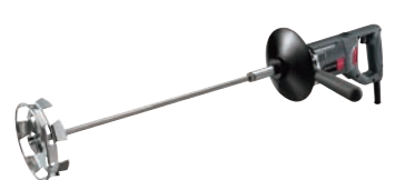
⑮リョービ パワーミキサー