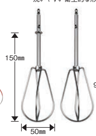
⑧クイジナート サイレントパワーハンドミキサー