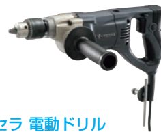
⑱京セラ 電動ドリル