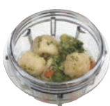
エビボールの中華煮 具材 65g・水 350ml/30秒