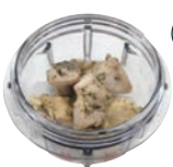
バジルチキン 具材 50g・水 30ml/40秒