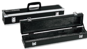
⑦ グレステン 庖丁ケース 小 ㊦