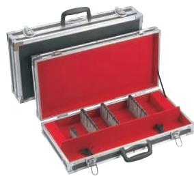
① スペシャルグレード ハードタイプ ナイフケース 大 ㊦