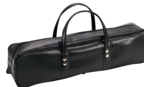
⑫ レザー ポストン型 庖丁ケース 黒 ㊦