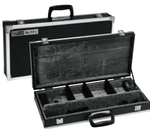
⑤ グレステン 庖丁ケース 大 ㊦