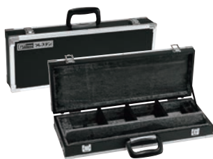
⑥ グレステン 庖丁ケース 中 ㊦