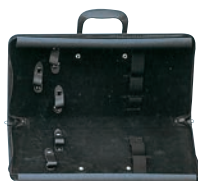
⑩ 学校用 庖丁ケース (5丁入) ㊦