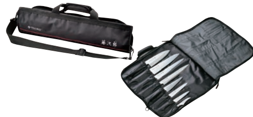
⑮ 藤次郎 ソフトナイフバッグ ㊦

材質:ポリエステル ●Lサイズ:刃渡300mmまで、12本収納可 ●Sサイズ:刃渡300mmまで、7本収納可