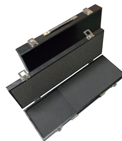
⑧ アタッシュケース (2丁入用) 黒 ㊦

仕切りナシ 外寸:570×125×H95 内寸:540× 95×H81 ※P326-②③④の庖丁巻などと組み合わせでのご利用をお薦めします。 ※刃渡36cmまで収納可能 鍵付