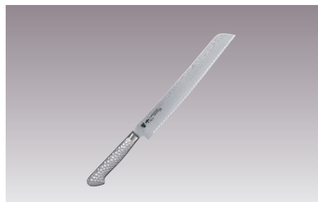
⑧響十 ブレッドナイフ 両