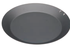
⑦ ココパン モーニング