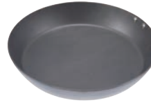
⑧ ココパン プレミアム