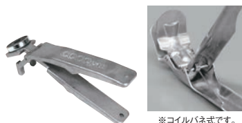
⑩ アルミ パングリッパー (マグネット付)