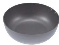
⑨ ココパン 鉄鍋