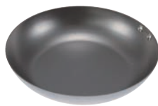
④ ココパン ベーシック