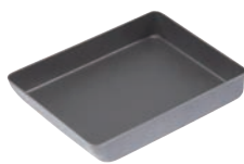
⑥ ココパン グリル