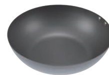
⑤ ココパン 炒め