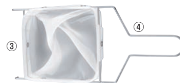
※フィルターとフレームは別売りです。