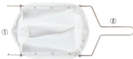
※フィルターとフレームは別売りです。