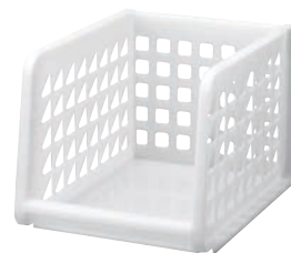
④ プレクシーラック ナチュラル A4深型