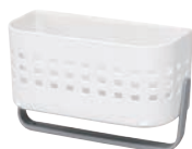
⑦ レア マグネットバスケット MB-3 (タオルパー付)