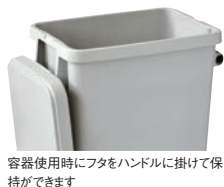
容器使用時にフタをハンドルに掛けて保持ができます

材質:本体・フタ/ポリプロピレン 排水栓/ポリエチレン キャスター/銅+エラストマー(自在×4、ストッパー2ヶ付)