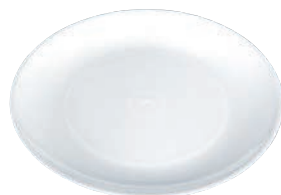
⑤丸皿 白 (10枚入)