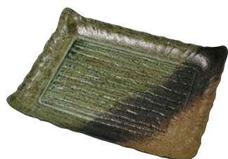
⑦筑後 民芸陶器風 (10枚入)