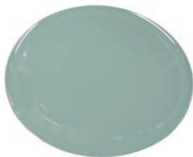
①高台皿 (5枚入) 青磁