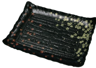
⑧筑後 春秋黒 (10枚入)