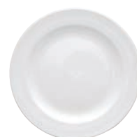
⑥洋皿 丸 白磁 (25枚入)