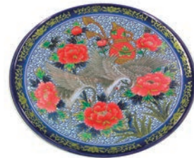
③高台皿 (5枚入) 紺 有田