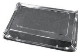
⑨筑後用 長方形 蓋 (10枚入)