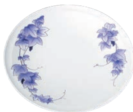
②高台皿 (5枚入) ぶどう