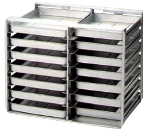
③アルミ 冷蔵庫用 パンラック N-14 納期