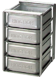
⑤アルミ 冷蔵庫用 パンラック N-4-H 納期