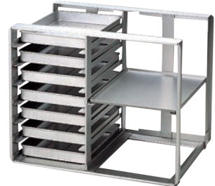
④アルミ 冷蔵庫用 パンラック N-7-T 納期