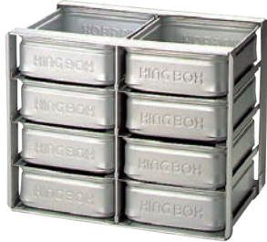
①アルミ 冷蔵庫用 パンラック N-8 納期

アルミパンラックの収納バットは、各別売となっております。(下記参照) ご注文の際は、適合バットの種類と必要な枚数をお知らせください。