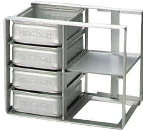
②アルミ 冷蔵庫用 パンラック N-4-T 納期