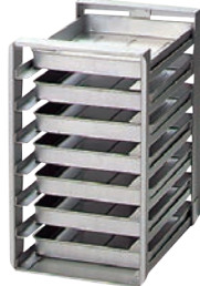
⑥アルミ 冷蔵庫用 パンラック N-7-H 納期