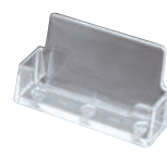
㉒ 名刺立て BC93 (横置き)