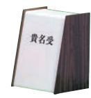
㉓ 木目 貴名受