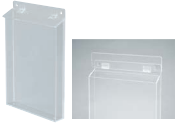
① アクリルパンフレットケース A4