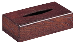
⑫ケヤクスリ ティッシュ BOX (L) ㊦