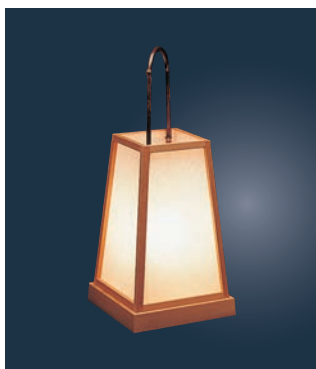
①路地あんどん 錦 ㊦