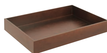
⑭ケヤキ合板 衣装盆 ㊦ ㊦A