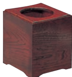
⑧和風 ケヤクスリ 屑入 ㊦