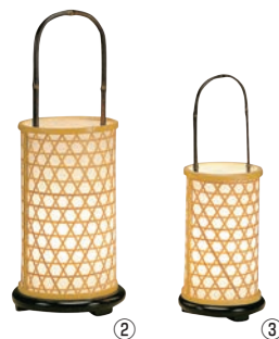
路地あんどん 葵 ㊦