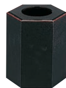
⑩ウレタン 六角千筋 屑入 ㊦