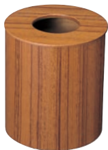
⑦チークダストボックス 蓋付大 ㊦