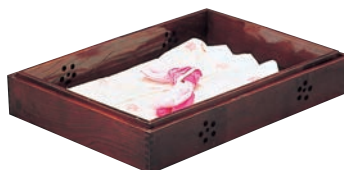
⑬木製 衣装盆 ムク スカシ入り ケヤキ色 ㊦ ㊦A