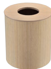
⑥ホワイトオーク ダストボックス 蓋付 ㊦

外寸:385×220×H490 材質:スチールクロームメッキ 折りたたみ式、タオル6枚掛