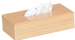
⑪白木ティッシュケース ㊦