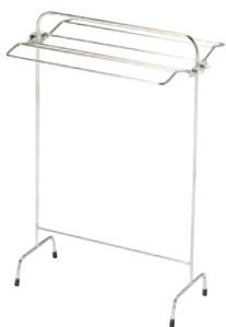
④タオル掛け S-1 ㊦

電源:単相100V 消費電力:38W コード長さ:1.8m ●竹で編み上げてあり、一層の雰囲気を演出します。