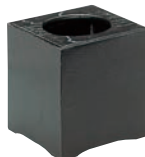
⑨和風 ケヤキ黒 屑入 ㊦