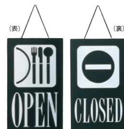
④ えいむ オープン・クローズプレート ブラック 加