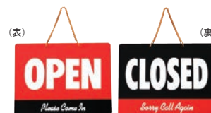
⑩ カナディアン オープンプレート 加