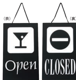
③ えいむ オープン・クローズプレート ブラック 加