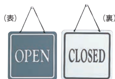
⑪ オープンプレート 加