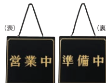
⑥ えいむ オープンプレート 営業中・準備中 黒 加