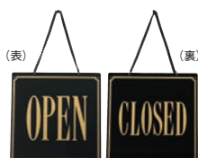
⑧ えいむ オープン・クローズプレート ブラック 加