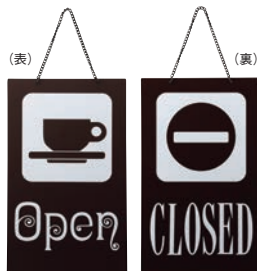
② えいむ オープン・クローズプレート ブラウン 加