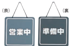
⑫ 営業中プレート 加