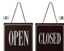
⑨ えいむ オープン・クローズプレート ブラウン 加