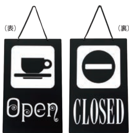
① えいむ オープン・クローズプレート ブラック 加