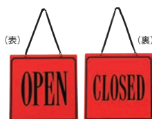
⑤ えいむ オープン・クローズプレート レッド 加